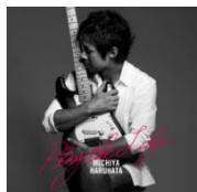
▲Play the Life

1985年6月1日 TUBEのギタリストとして「ベストセラー・サマー」でレコードデビュー。 1986年3rdシングル「シーズン・イン・ザ・サン」の大ヒットでバンドとしての地位を確立。 1987年TUBEと並行してソロ活動を始め、現在までにシングル3枚とアルバム11枚（ミニアルバム含む）をリリース。1992年シングル「J'S THEME」が日本初のプロサッカーリーグであるJリーグ・オフィシャル・テーマソングとなる。1993年のJリーグオープニングセレモニーでは音楽を担当、国立競技場の約6万人の観衆の前にライブを行った。2002年5月9日米国のギターメーカー・フェンダー社と正式にアーティストエンドース契約を交わした。春畑のギターテクニックとセンス、またコンポーザーとしての実力ミュージシャンへの影響力、そしてフェンダーをこよなく愛する姿勢が総合的に認められて全面的なサポートが約束された。エリック・クラプトンなどの人気、実力、影響力を兼ね備えたギター・プレイヤーのシグネチャーモデルを誕生させてきたフェンダー社が初めて日本人ギター・プレイヤーとして春畑道哉モデルを発売し、春畑にとって栄誉なことであり、日本のミュージックシーンにとって記念すべき出来事となった。