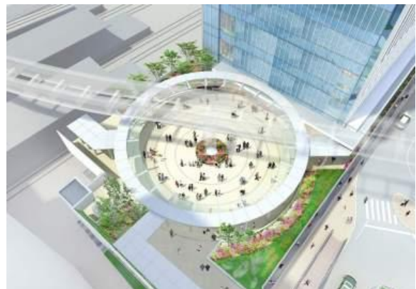
立川駅北口 公開広場完成イメージ