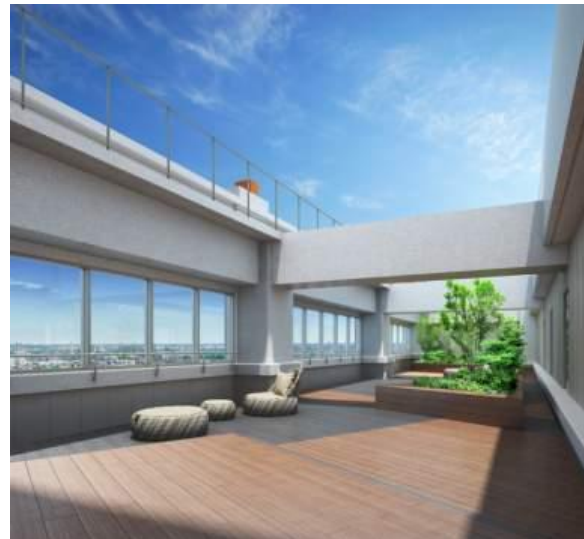
ルーフトップテラス完成予想図