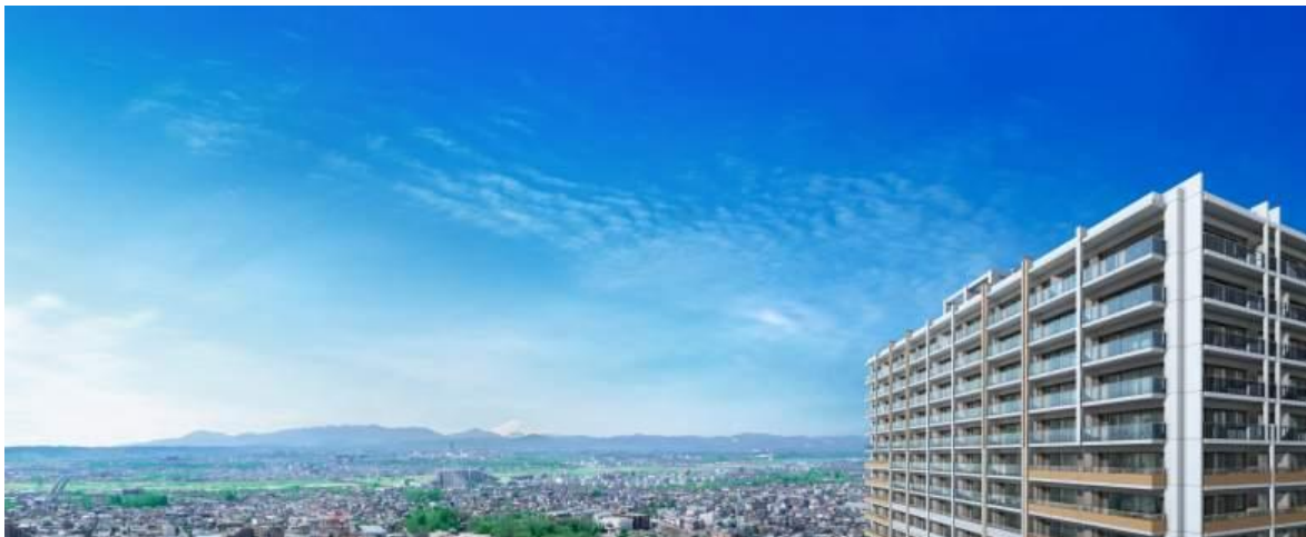
プラウドタワー立川 外観完成予想図