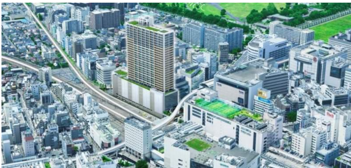
プライドタワー立川 外観完成予想図