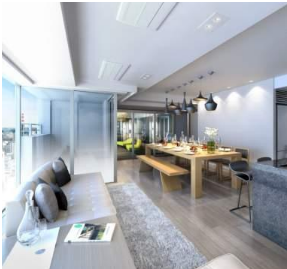
パーティーラウンジ完成予想図