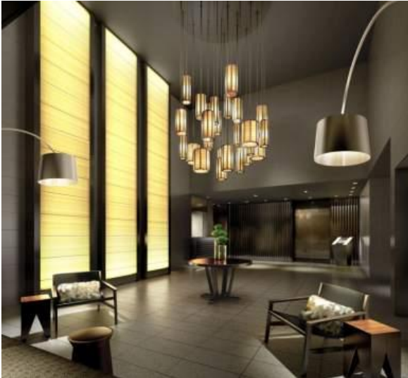
グランドロビー完成予想図

『プラウドタワー立川』は立川市の新たなランドマークとなる立川市最高層、地上 32 階建、約 128mの全 319 邸のタワーマンションです。ペDESTリアンデッキで駅直結された建物は、一歩中に足を踏み入れると駅前の喧騒とは一線を画したラグジュアリーな空間が居住者を迎えます。ランドマークとなるタワーマンションにふさわしい多彩な共用部が居住者の生活を彩ります。