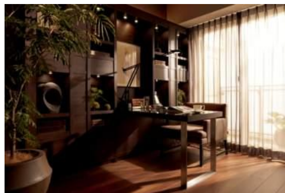
プライドタワー立川 モデルルーム写真