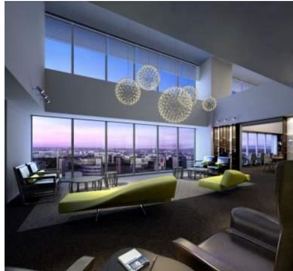
パークビューラウンジ完成予想図