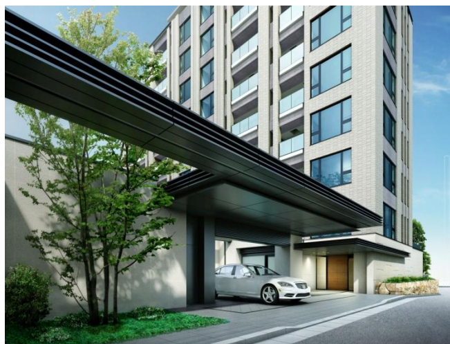
建物完成予想図、物件案内図