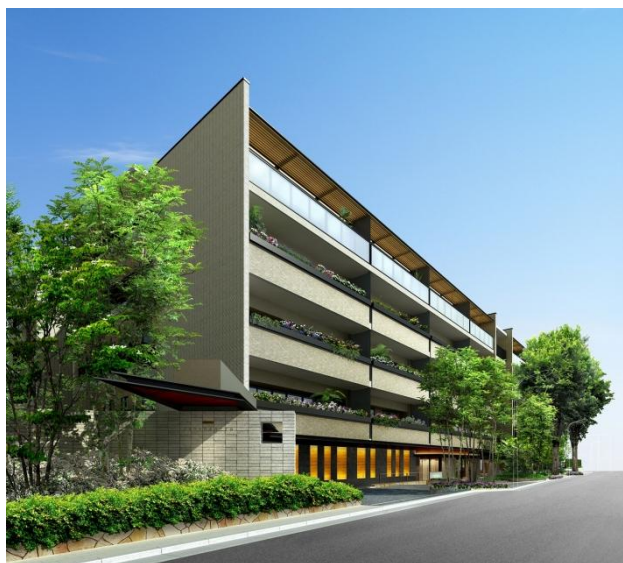
プライド白金台三丁目 外観完成予想図