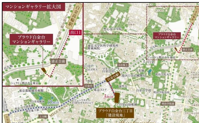
建物完成予想図、モデルルーム写真、物件案内図