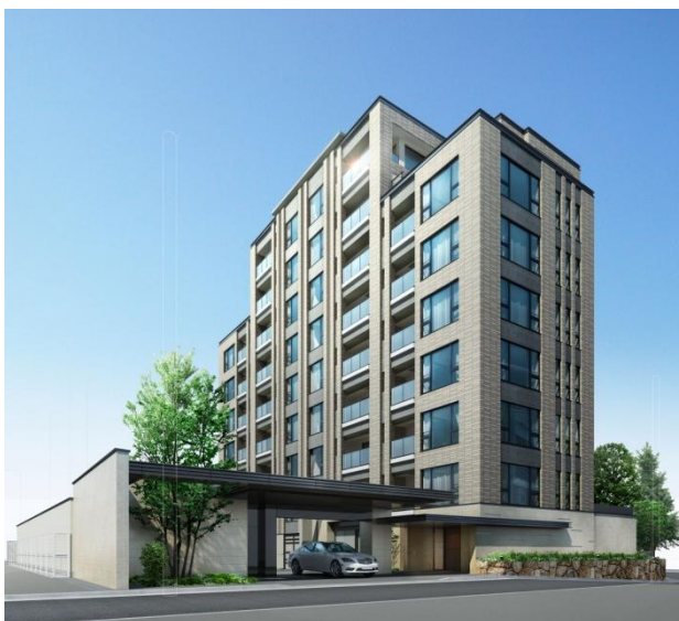
プライド自由が丘 外観完成予想図