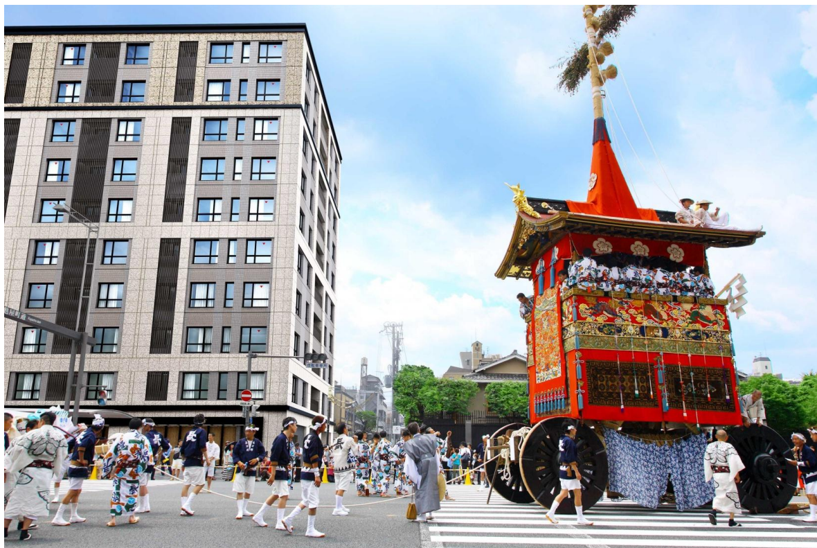
『プライド京都麩屋町御池』 外観完成予想図

当社は、当物件を皮切りに今後、京都市内中心部でのプライドの開発を積極的に推進してまいります。