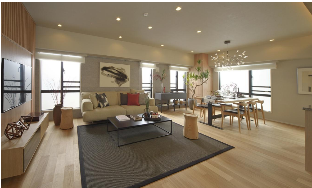
1タイプモデルルーム リビングダイニング写真