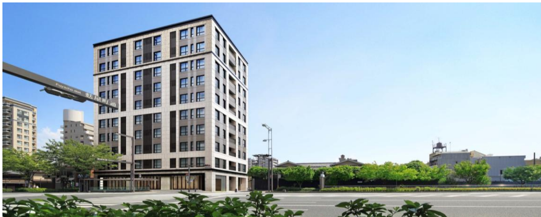
内廊下・外観完成予想図