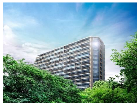
プラウドシティ加賀学園通り