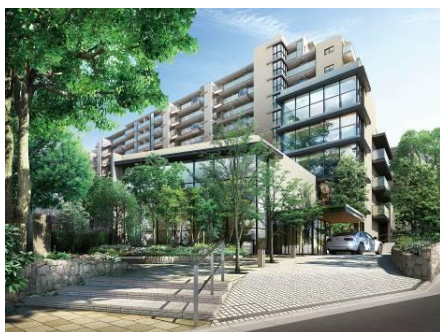
プラウドシティ南山

本年11月以降営業開始となる、原則50戸以上の首都圏・中部圏・仙台圏の「プラウド」より新体制にて導入開始いたします。「プラウドシティ南山」「プラウドシティ加賀学園通り」「プラウド山王」「プラウド稲毛小仲台」が第一弾導入物件予定となります。