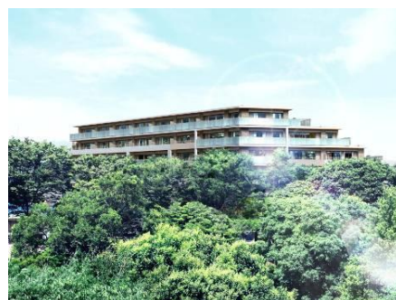
プラウド稲毛小仲台