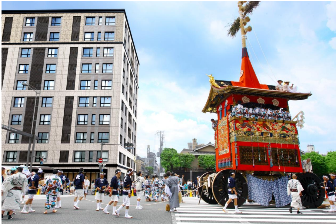
【プラウド京都麩屋町御池 外観完成予想図】