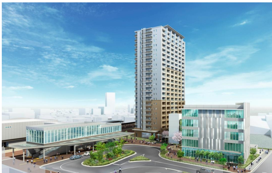
« 建築物のイメージパース »