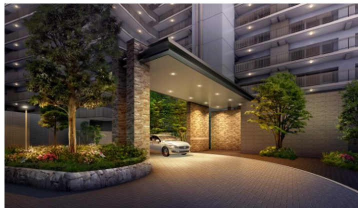
「プライドシティ塚口マークスカイ」 車寄せ 完成イメージ