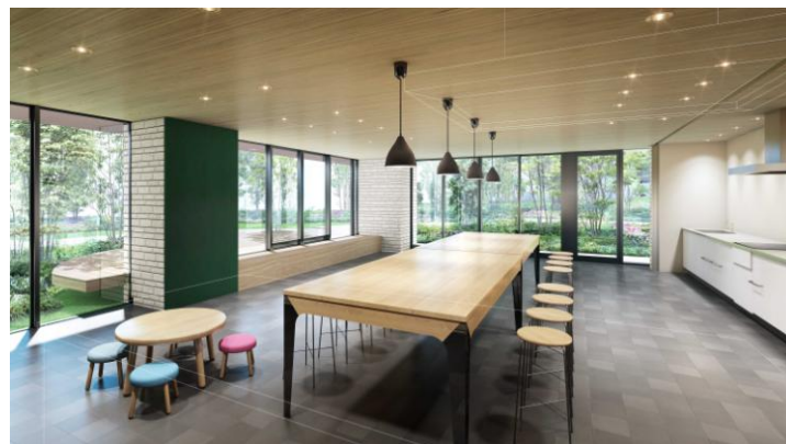
「プライドシティ塚口マークスカイ」 集会室兼キッチンスタジオ 完成イメージ