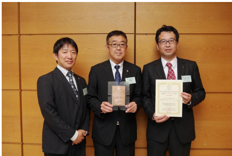
5月24日に行われた授賞式の様子 [ 表彰状を手にする共同開発会社3社の代表者 ]