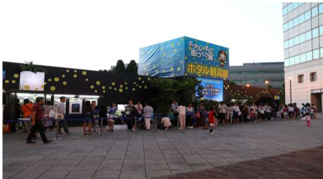
【昨年設置したホテル観賞館の様子】