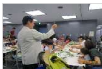
【昨年実施したオープニングイベントの体験コーナーの様子】