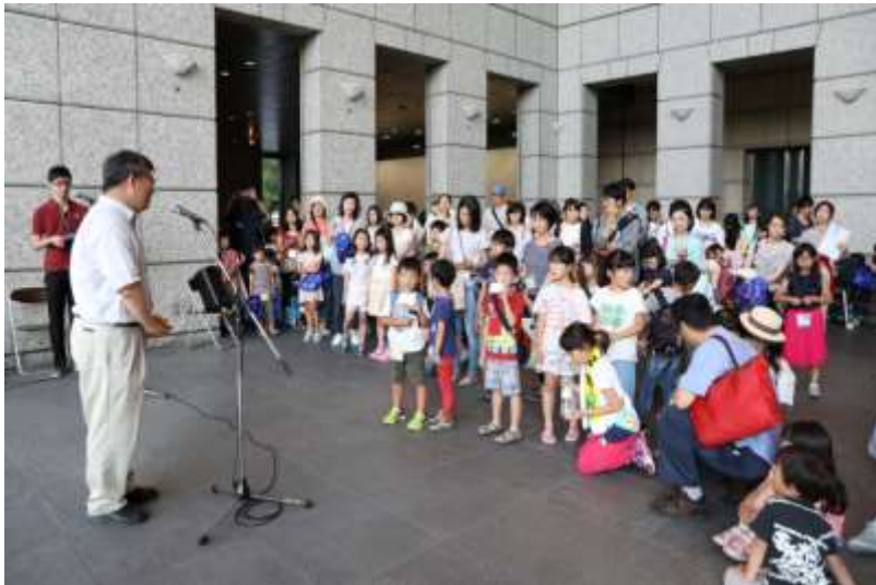
【昨年実施したオープニングセレモニーの様子】

今回は6月2日（土）にオープニングセレモニー「ホテルを楽しむ夕べ」（事前予約制/満席）を開催し、「エコライト工作」、「ホテルの放翔」、「草玩具づくり」、「水のふしぎ実験室」などのイベントに多くの小学生を招き、自然や生物の大切さに触れ合える場を提供いたします。また、11月までの期間、地元の小学生向けに、お米作りを体験してもらった「稲作り」や、YBP テナント企業様ご協力のもと「おもしろ科学体験会」を開催し、当社及び YBP テナント企業様と地域との交流を図ってまいります。