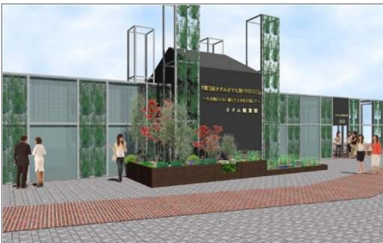
【昨年実施したホタル鑑賞特設ブース内部の様子】