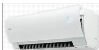
省エネ型ルームエアコン (参考写真)