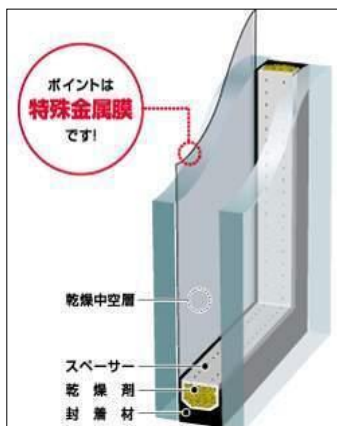
エコガラス概念図