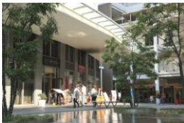
堂島クロスウォーク／ほたるまち

また、堂島川の水辺に位置し、京阪中之島線、JR東西線、阪神本線、JR環状線の4線4駅に徒歩圏、キタ・ミナミエリアにもアクセスしやすく、周辺には、現在建替え中の「関西電力病院」をはじめとするさまざまな利便性ととも、中之島公会堂、国立国際美術館、大阪市立科学館、ABCホール、堂島リバーフォーラムなど文化的な面も備えた多彩な都市機能を集約しています。