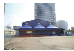
ルナ・レガロ口※1/26にて終了