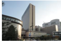
リーガロイヤルホテル