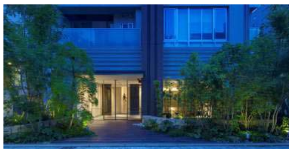
エントランスホールの灯りが漏れる前庭(夜景)