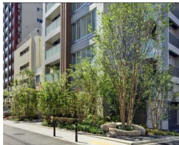
人々のふれあいの場(シンボルツリーと低めの石垣)