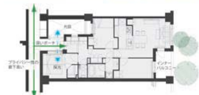
独立性と緑のある生活