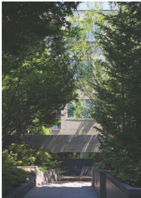
<<参考資料 プラウド等々カ 竣工写真>>