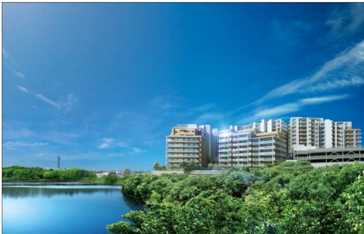
イメージ図：全体鳥瞰図

『ラグナヒルズ』は、南側に「猫ヶ洞池」、東側には「東山の森」が広がる東山丘陵に抱かれた都心からわずか 6 キロ圏に位置する全 300 邸の分譲マンションです。