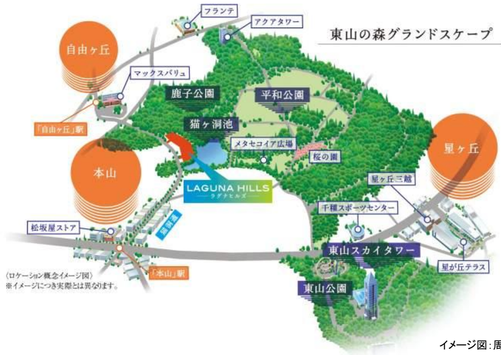
イメージ図:周辺地図