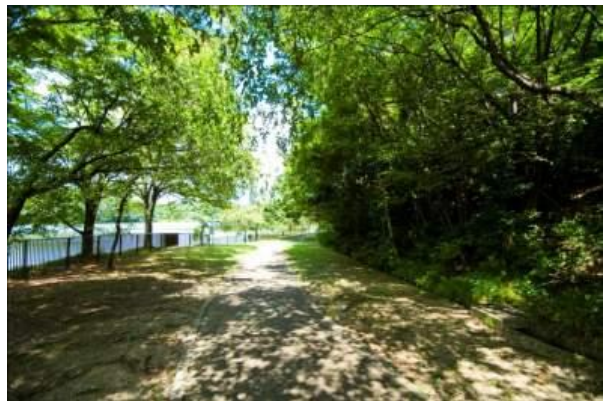
平和公園一万歩コース写真