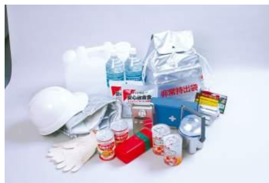
イメージ写真: 防災倉庫