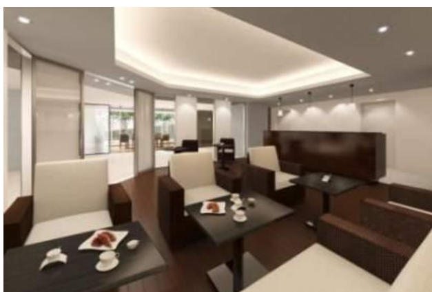
イメージCG: ラグナカフェ