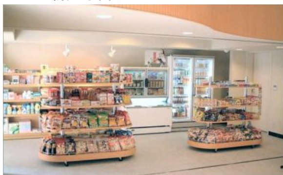
イメージ写真: ラグナマート

◇防災倉庫や備蓄倉庫の機能も兼ねたミニコンビニラグナマート、WiFi 機能付き自動販売機設置などの防災対策。