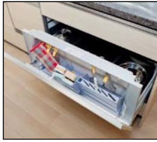
＜シンク下ドアポケット＞(参考写真)