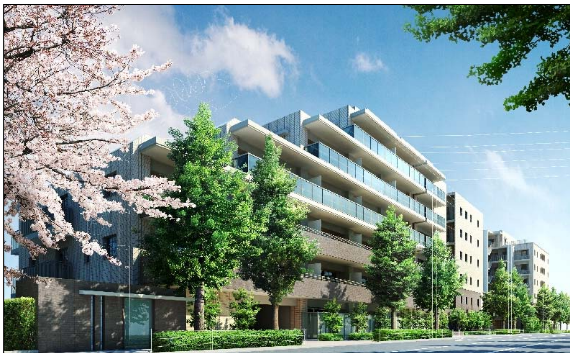
<外観完成予想図(ブライトレジデンス)>