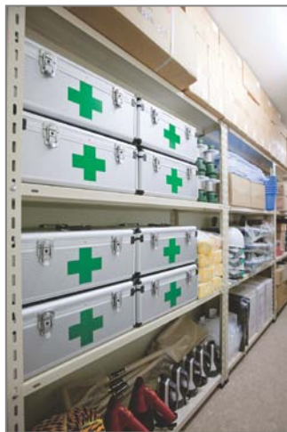
＜防災倉庫＞(参考写真)