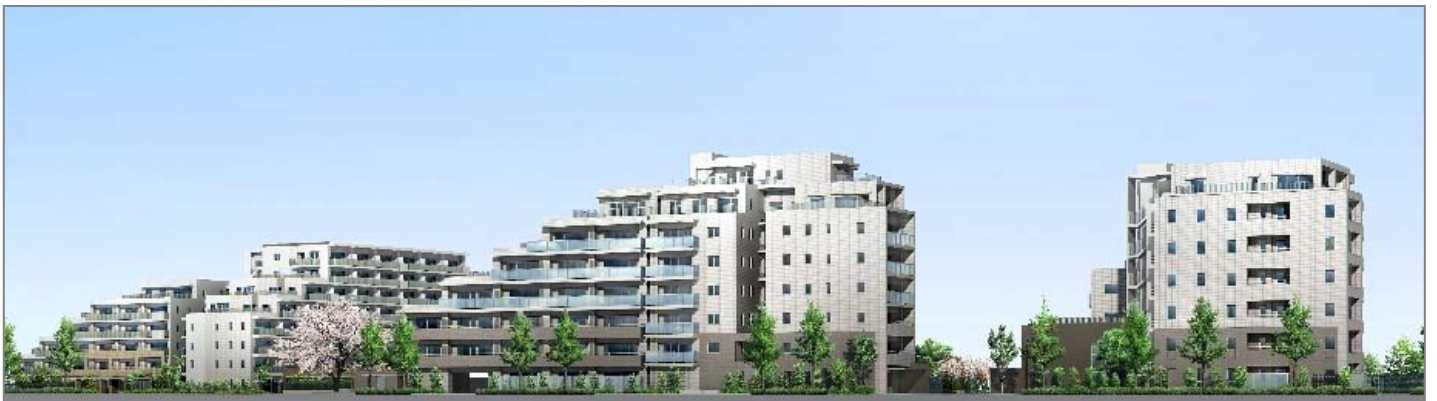
<完成予想図(左:エアリーレジデンス・119戸、中央:ブライトレジデンス・65戸、右:カームレジデンス・35戸)>