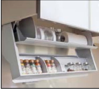
＜クイックポケット＞(参考写真)