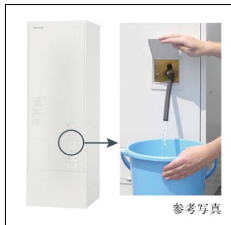
＜貯湯タンクの非常用取水栓より水の取り出し＞(参考写真)