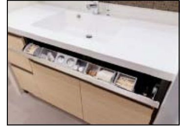
＜スマートポケット＞(参考写真)