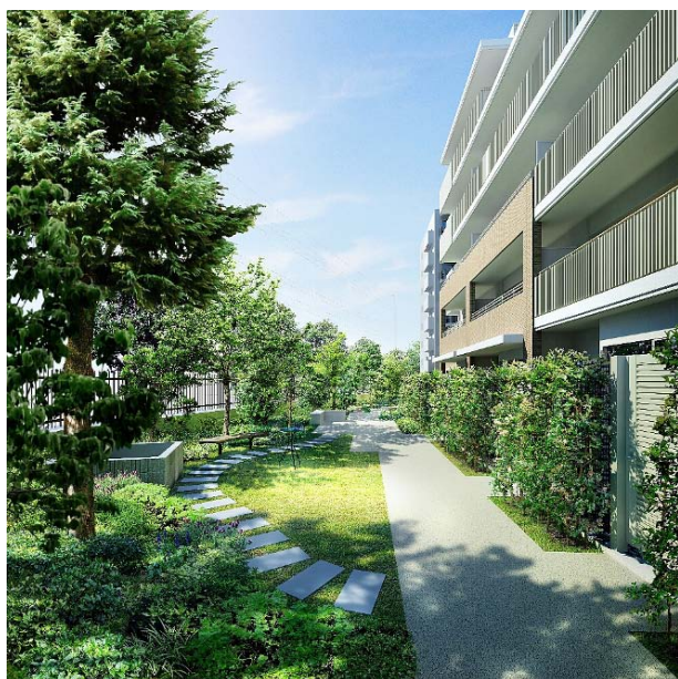
<陽だまりのガーデン完成予想図(エアリーレジデンス)>