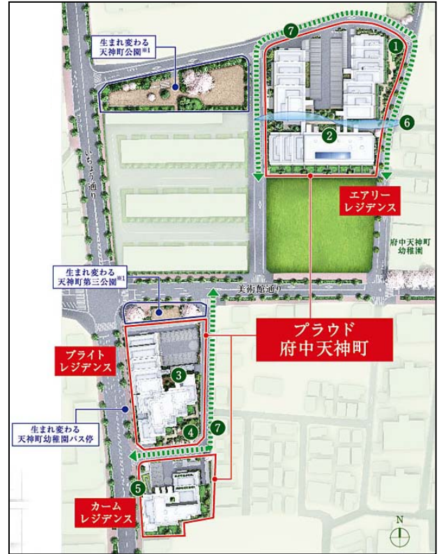
<プロジェクト敷地配置図>

約 1,700 ㎡のゆとりのある「天神町公園」と樹齢 50 年程の桜の木を中心とする「天神町第三公園」を再整備し、マンションの敷地内にも「陽だまりガーデン」や「センターガーデン」、「フォレストガーデン」を設け、さらに、いちょう通り側には建物を道路境界から最大 3mセツバックさせ、歩道側に緑を創出する「グリーンプロムナード」やバス停前にベンチや緑を設けるなどバスを快適に待つための空間を整備