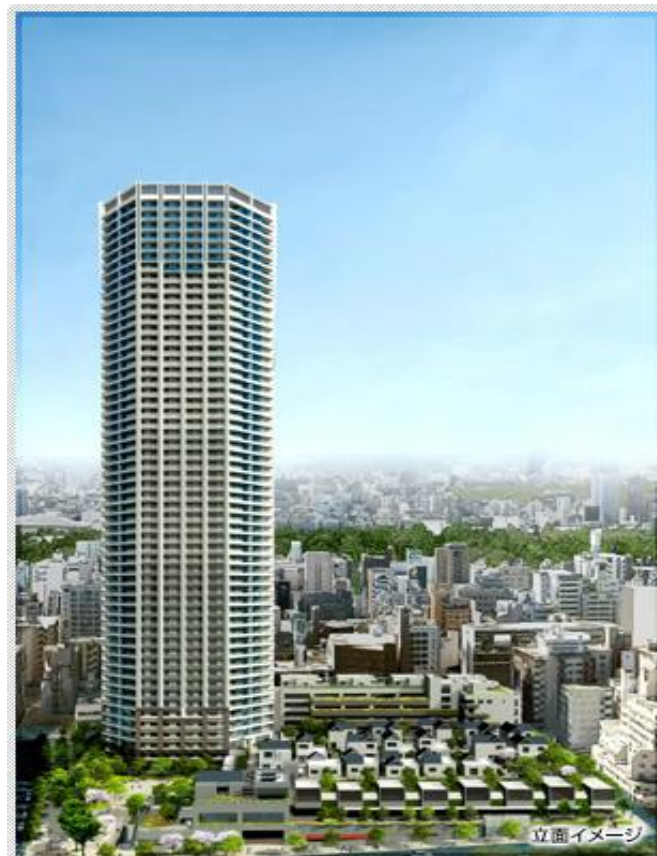
〈 施設建築物の外観完成予想図 〉