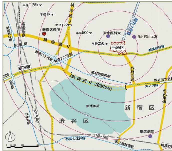
〈 周辺区域図 〉