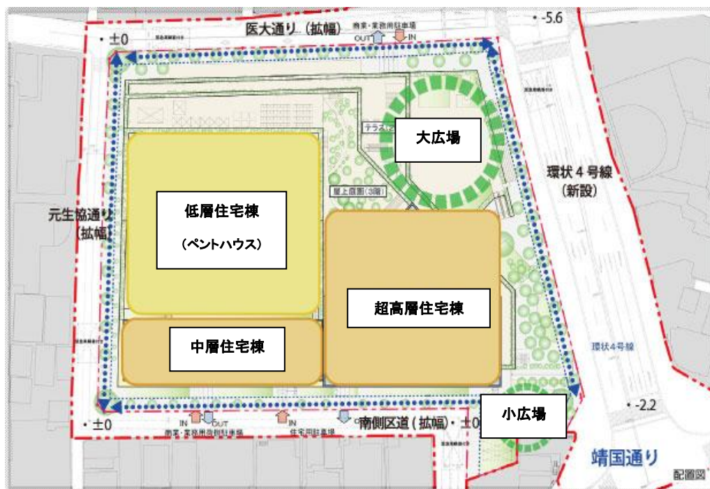
〈 敷地配置図 〉