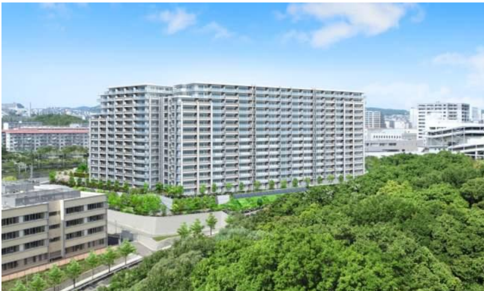
「プライドシティ神戸名谷」外観完成予想図