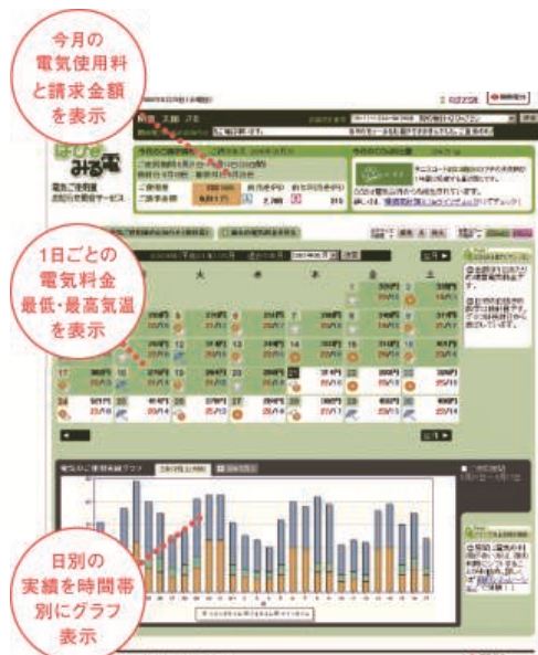
【エネルギーの見える化（イメージ）】