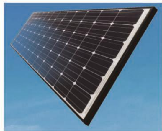
【業界最高水準※3の発電量の太陽光パネルを採用】