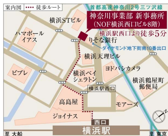
<神奈川事業部 事務所地図>