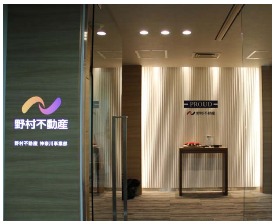
<神奈川事業部 事務所玄関写真>