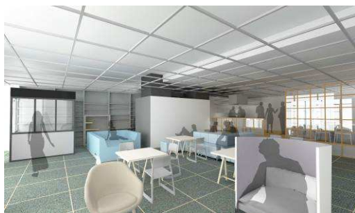
イノベーションスタジオイメージ(7月開所予定)

Tsunashima SST SQUARE1 階に位置し、タウンサービスや街のさまざまな活動の中核を担うマネジメント拠点、災害時の支援拠点の他、イノベーション創出のための拠点。パナソニックが技術・マーケティング実証を行うなど、さまざまなオープンイノベーションを創出するためのスペース「イノベーションスタジオ」、国際交流・地域交流、知の交流の促進や、街の情報発信のためのスペース「エクステンジスタジオ」、セキュリティサービスなどの拠点となる「タウンサービススペース」などがあります。