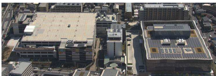
Tsunashima SST 全景

Tsunashima SST 協議会は、今後も継続して地域の価値向上につながる取組みを推進していきます。横浜市は、新横浜都心、日吉・綱島地区を中心とした環境モデルゾーンの取組みを進めており、その一翼を担う Tsunashima SST 協議会と連携し、先進的な取組みを広げ地域の価値向上を目指します。