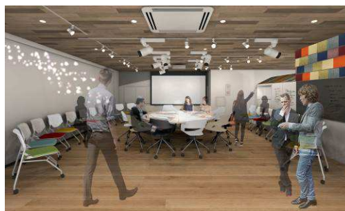
エクステンジスタジオイメージ