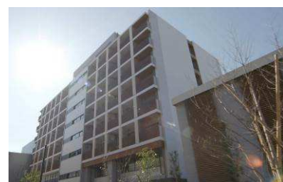
Tsunashima SST SQUARE