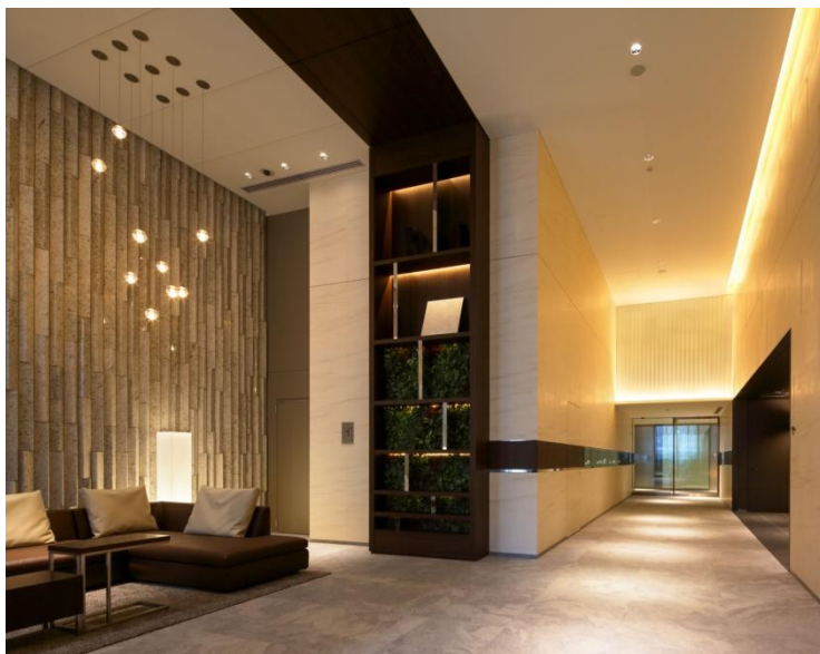
左上:3階ステーションエントランス 右上:5階パーティールーム・カルチャースペース 左中:5階スタディースペース 右中:5階ゲストルーム 左下:5階パーティールーム・カルチャースペース 右下:1階グランドエントランス