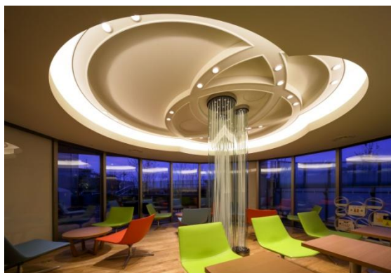
プライドタワー大泉学園 竣工写真(左:外観、右上:1階グランドエントランス、右下:6階ガーデンラウンジ)