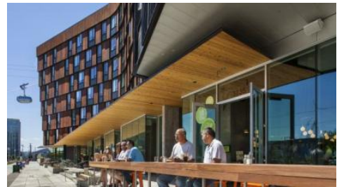
ZGF アーキテツ実績 The Emery:ポートランドのミクストユース・プロジェクト ©Eckert&Eckert