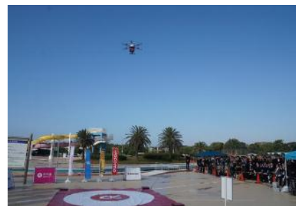
千葉市ドローン宅配分科会風景（千葉市ホームページより）

国家戦略特区に指定されている千葉市は、幕張新都心を中核とする近未来技術を活用した街づくりを目指しており、現在様々な先端技術の実践活用が検討されています。具体的には、本プロジェクトエリア内における生活必需品や医薬品の「ドローン宅配」の検討や、幕張新都心内の公道（車道・歩道）を利用した「自動運転モビリティ」運行サービスなどの実現に向け、様々な分野の英知を結集した官民共同での実証実験を開始しています。