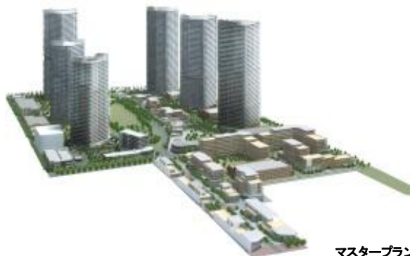
マスタープランに基づく街並みイメージパース ※5