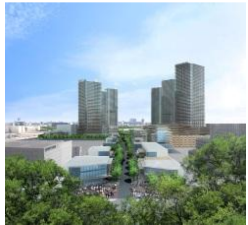
マスタープランに基づく街並みイメージパース ※7

『幕張ベイタウン ※6 』の街づくり開始から約20年、『(仮称)幕張ベイ Towers プロジェクト』では「街の賑わい」というソフト面をさらに充実させるため、2つの主要エリアを計画しています。具体的には、①海浜幕張駅や周辺地区から人々を招き入れる「商業エリア」、②この街の人々が子育て、自己研鑽等できるローカルサービスを充実させ、街の中心となる公園を通じて人々が様々なアクティビティを楽しむ「コミュニティエリア」。この2つのエリアで職・住・学・遊の各要素が街全体として機能し、多世代交流を可能にする“人が集まる都市”をデザインします。このように、「街の賑わい」つまり活気をもたらすことは、エリアマネジメントにおける価値形成に欠かすことができない要素と位置付けています。