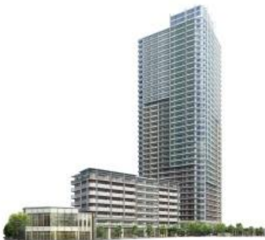
完成予想外観パース※1

<本物件ホームページURL> http://www.makuhari-pj.com/shinchiku/G1502001