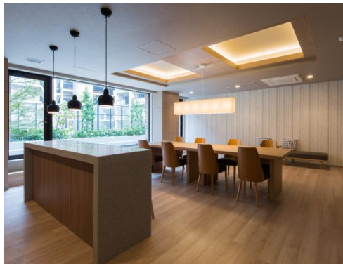
パーティーラウンジ