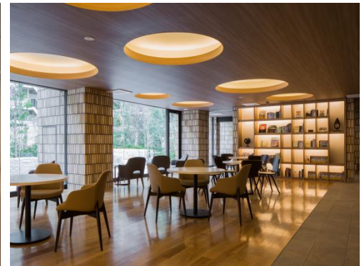
フォレストカフェ