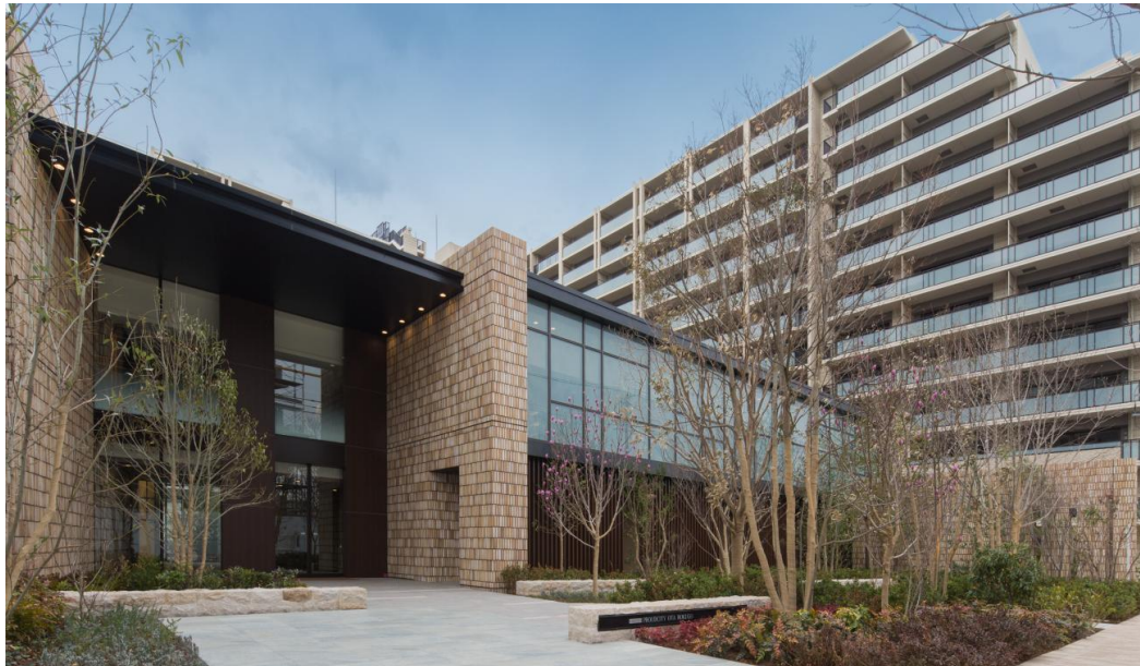
フォレストコートエントランス

当物件は、20代・30代を中心とした都心勤務の共働き世帯からご評価を頂き、「3LDK(68.36㎡)4,100万円台～」の価格設定として、既に5,000件超のご来場を頂いており、506戸を供給しております。当社では、共働き世帯を始め、社会の様々なニーズに対応しながら、人や街が大切にしているものを活かし、「 あした 未来につながる街づくり」を通じて社会に向けた新たな価値を創造してまいります。