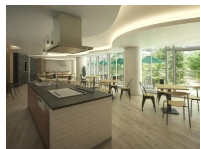
パーティールーム (1・2)