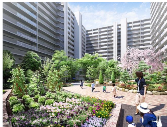
センターフォレスト