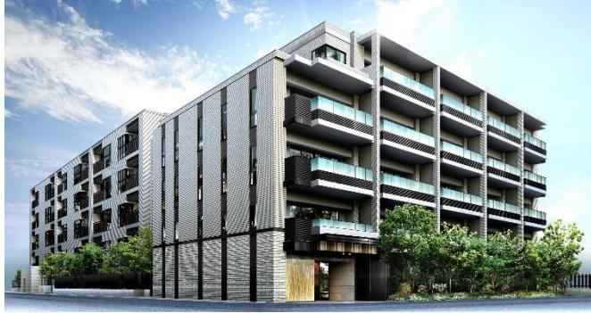
(左右ともに)「プラウド日暮里テラス」完成予想パース