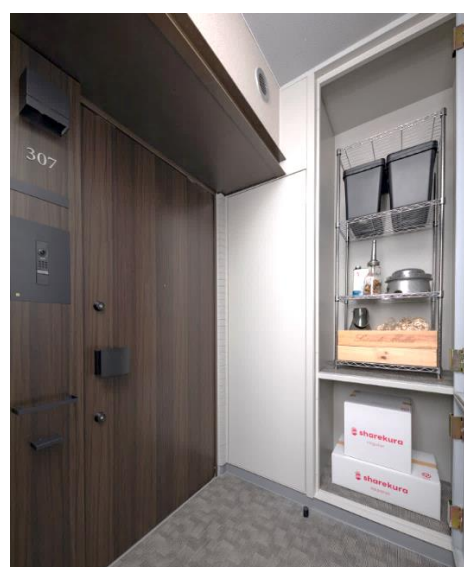
「プライド日暮里テラス」モデルルーム写真