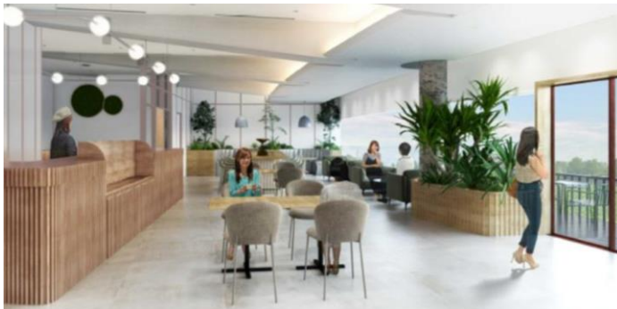
カフェを併設した一般ワークスペースイメージ・現段階の予定であり今後変更になる可能性があります

施設併設のカフェでは、淹れたてのコーヒーのほか軽井沢ならではのジュースや軽食の販売をいたします。オープンスペースでの飲食、お土産としてもお持ち帰りいただけます。