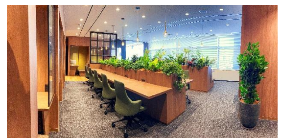
H 1 T 大手町