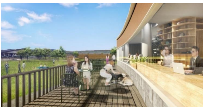
施設イメージ・現段階の予定であり今後変更になる可能性があります