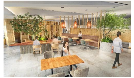
施設イメージ・現段階の予定であり今後変更になる可能性があります

施設運営にあたっては、新型コロナウイルス感染症予防を目的として、定期的な除菌清掃、換気、除菌用品の設置などの対策を徹底して実施しております。