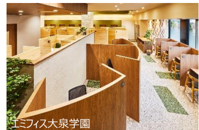
エミフィス大泉学園