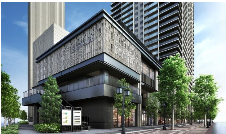
プラウドタワー川口クロス 商業フロア 完成予想図

また、商業フロア内には、災害時の帰宅困難者等の一時滞在スペースの設置等を行い、地域の防災拠点としての役割を果たします。