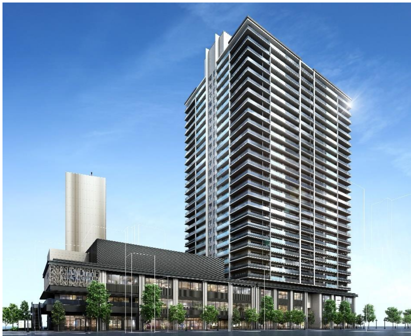
プラウドタワー川口クロス 完成予想図

本物件は、事前エントリー数が3,500件を超え、コロナ禍の状況においてもより多くのお客様をご案内できるよう、オンラインでの案内会も開催予定です。