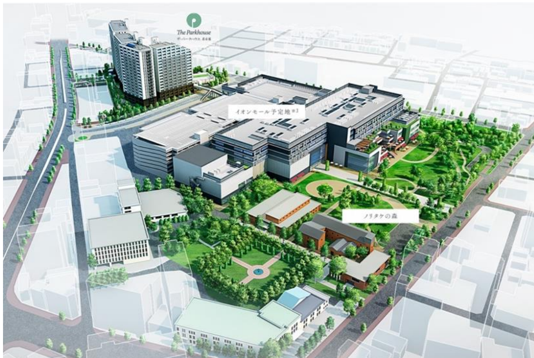
▲地区計画完成予想 CG

総面積約11.8ha。「名古屋」駅にほど近い距離で広大な用地を擁す「ノリタケの森地区計画内」に誕生。緑豊かなノリタケの森、オフィス複合型という新コンセプトのイオンモールにレジデンス棟が加わり、新しいスタイルのまちづくりが実現しました。