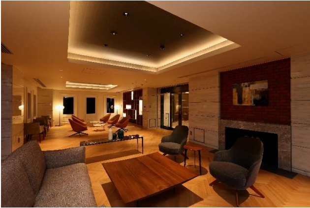
▲センタースクエアラウンジ