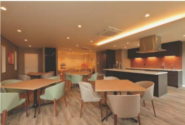
▲キッチンスタジオ