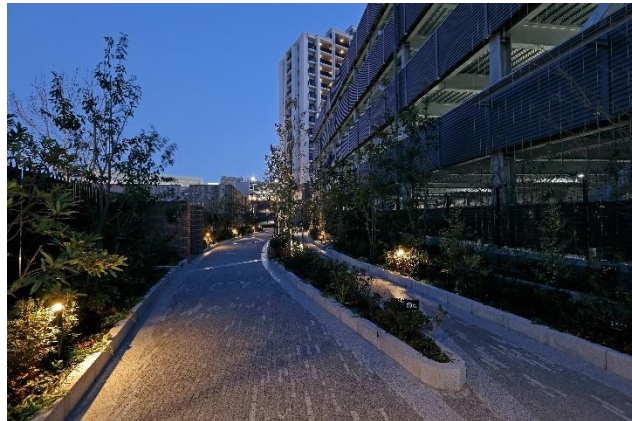
▲光の空間デザイン