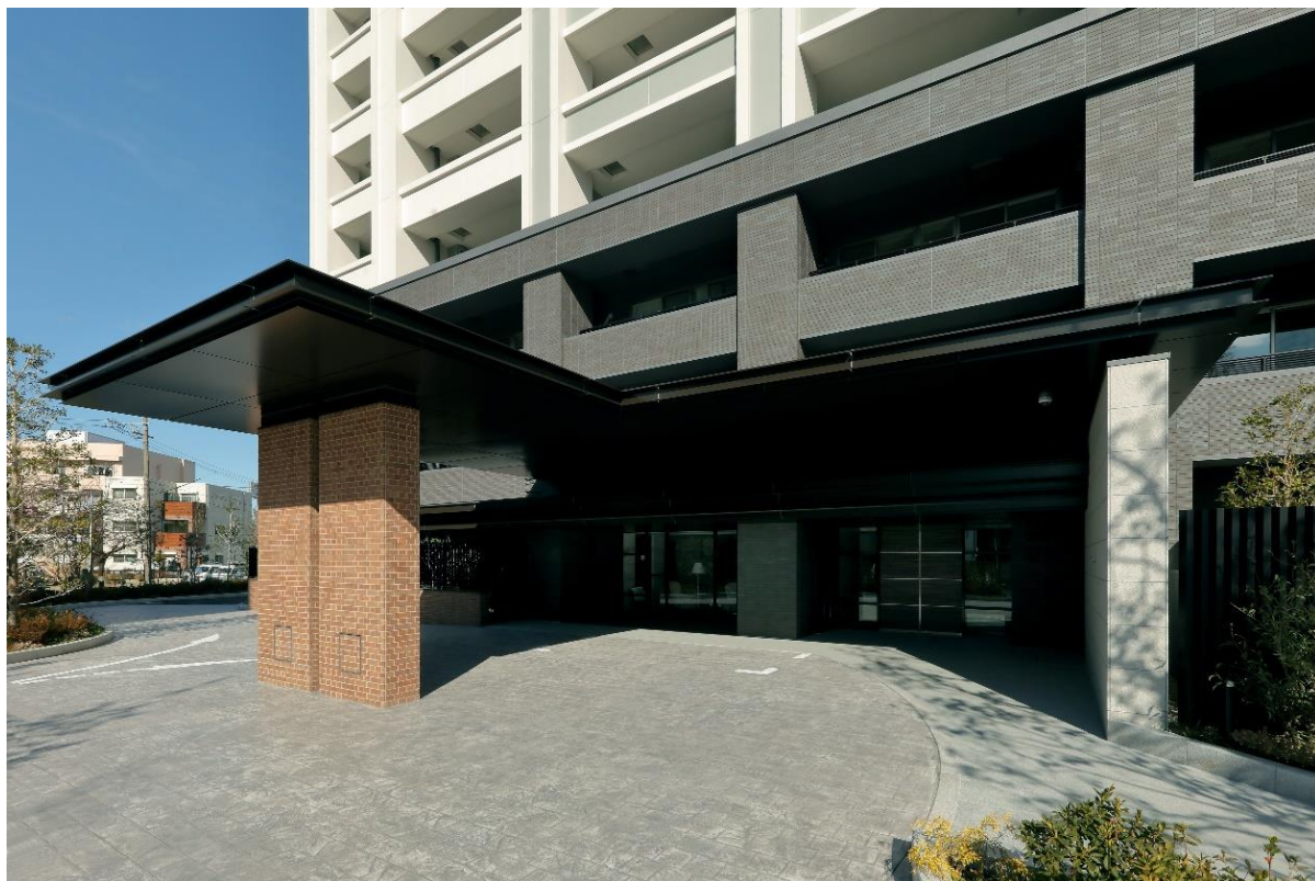
▲アベニュースクエアエントランス

大規模マンションならではの 3つのエントランスをはじめ、ラウンジ、ゲストルーム、パーティールームなどに、イタリアの「アルフレックス」社製を中心とした家具を採用。上質なインテリアを備えた充実した共用施設が生活を彩ります。またスタディールームに続く空間にテレワーク用の防音型コミュニケーションボックス「テレキューブ」を 2 台設置。多彩なニーズにお応えします。