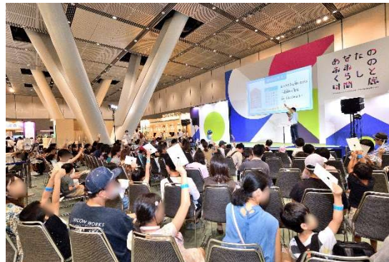
【「あなたの未来の暮らしと時間展」の様子】