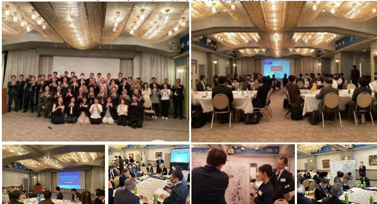
【2023年10月23日 まちづくり勉強会の様子】