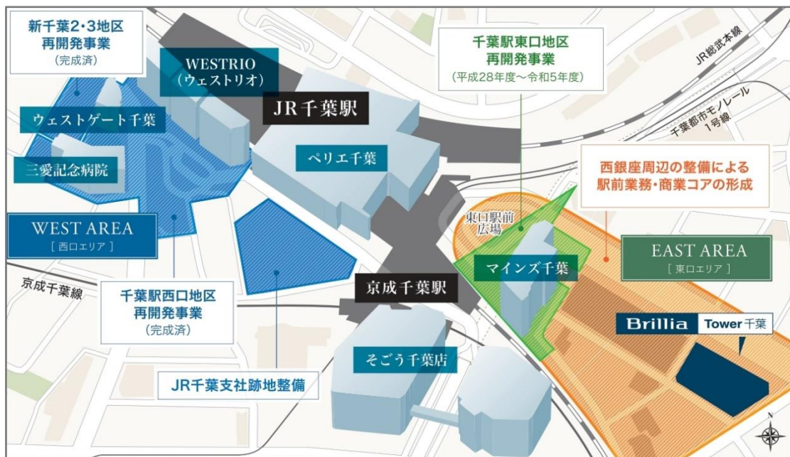
千葉駅周辺再開発概念図

※1 https://www.city.chiba.jp/toshi/toshi/toshinseibi/chibaeki_gd.html