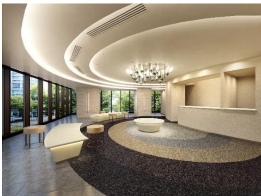
エントランスラウンジ (イメージ)

2階にはエントランスラウンジ、フィットネスルーム、ゴルフレンジ、マルチスタジオ、近隣住民も利用できるコワーキングスペースを配置。3階には、ゲストを迎えるオーナーズスイート2室とパーティールームを配置するなど、居住者の多様なライフスタイルを演出します。