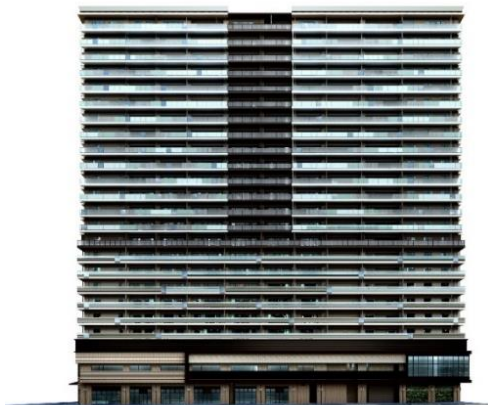
北側建物外観（イメージ）

低層部では街のにぎわいを演出する木調の大庇を設けました。中上層は、空を映し出し、風景に溶け込むガラス手すりを採用することで、周辺への圧迫感を軽減しています。