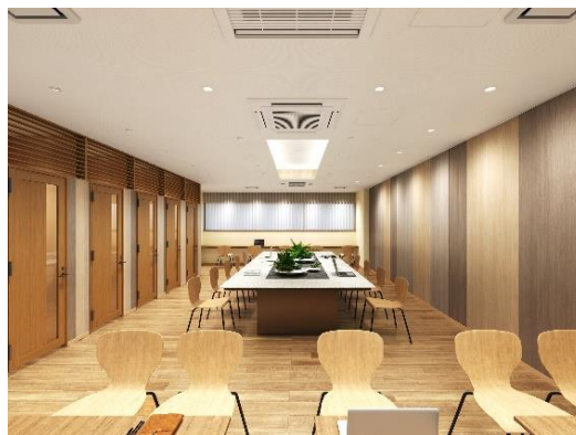
コワーキングラウンジ (イメージ)