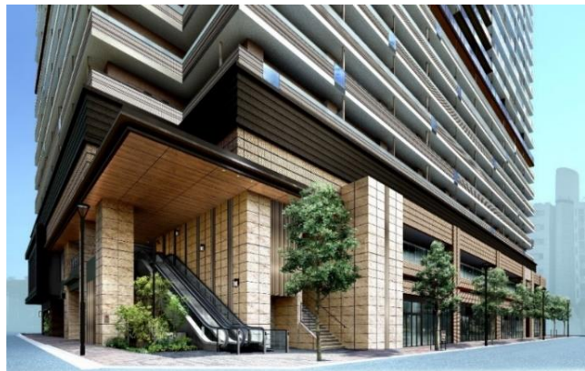
住居エントランス部分（イメージ）