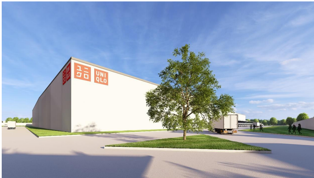
【フィリピン カビテ州に建設する FNG の物流倉庫 完成予想イメージ】

※1 主に大型物流施設において、賃貸者の要望に応じてオーダーメイドで建設する類型の一つ