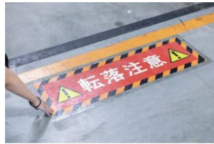
耐久性に優れた 注意喚起