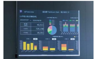
消費電力の 可視化システム