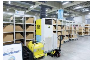
高出力かつ可搬型の カスタムエアコン