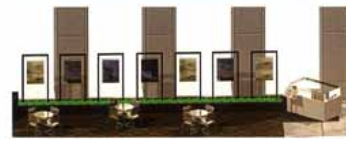
穏やかで温かいホテルの光に包まれる 都会にしながら、自然を身近に感じる空間(新宿野村ビル展示スペースイメージ図)

「新宿野村ビル」では、以前は里山で見ることが出来た樹木や植物を植え、川のせせらぎを作り、水棲昆虫や水草が生息する小さな自然を再現します。また、昨年この会場で生まれたホテルをはじめ、実物のホテルがご覧いただけます。また6/3(火)には幼稚園児童による『メダカの放流セレモニー』を開催いたします。