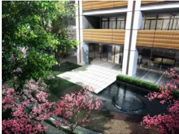
円居の庭(スカイクロスタワー)