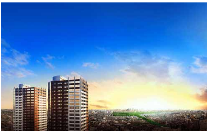
井の頭恩賜公園を眼下に新宿副都心方面を望む

駅前という、交通至便なポジションに立地する武蔵野 Towers は、クリニックモールをはじめ、ショッピングセンターやフィットネスクラブ、公共施設など様々な機能を包括した複合開発プロジェクトです。また、スカイゲートタワー 20 階とスカイクロスタワー 23 階に備えた居住者専用スカイラウンジからの都心や富士山などの眺めも大きな魅力の一つとなります。