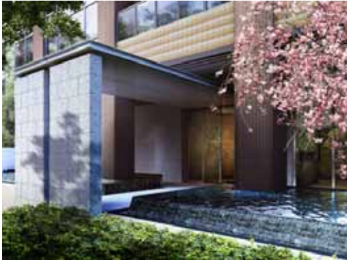
「スカイゲートタワー」メインエントランス