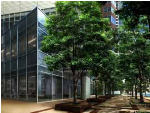
タワーズモール(商業フロア)