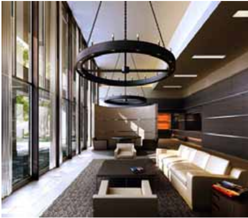
オーセントロビ - (スカイクロスタワー)