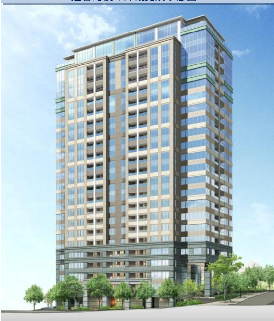
建替え後の外観完成予想図