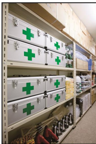
<防災倉庫> (参考写真)