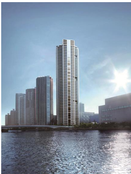
<『プラウドタワー東雲キャナルコート』完成予想図>