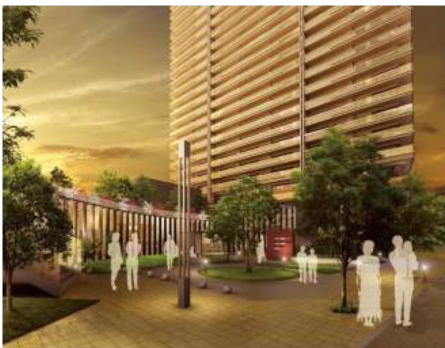
外観イメージイラスト(公開空地)

※各イメージイラストは設計図書をもとに描いたもので、形状・仕上・植栽・色彩等は異なります。