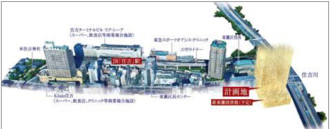
「旧東灘区役所跡地再開発プロジェクト」計画予定地全体パース

分譲マンション(レジデンス棟)は野村不動産、近鉄不動産、長谷工コーポレーションの開発となります。