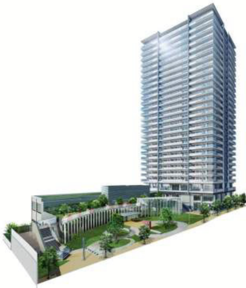
外観イメージイラスト(全景) (左)低層棟:文化施設棟(図書館・だんじり資料コーナー) (右)高層棟:分譲マンション(レジデンス棟・カフェ)