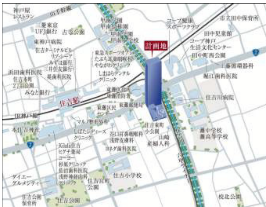
「旧東灘区役所跡地再開発プロジェクト」周辺地図