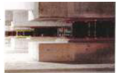
■ 免震装置参考写真(積層ゴム)

地震による地面の激しい揺れが上部の建物に伝わりにくいように工夫された免震構造を採用。建物と基礎を切り離し、その間に積層ゴムなどの部材を設置して建物に入る地震動を低減する仕組みです。