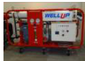
非常用飲料水生成システム「WELL UP」