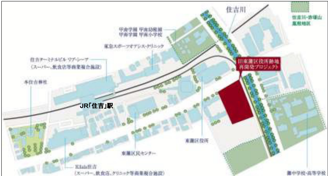
「旧東灘区役所跡地再開発プロジェクト」計画予定地と周辺街区

本プロジェクトの計画地は、この住吉川河畔に広がる風致地区と、JR住吉駅からつづく東灘区の中核地区とが交差する地点に位置し、住吉ならではの豊かな環境と都市としての利便性を兼ね備えた地域です。