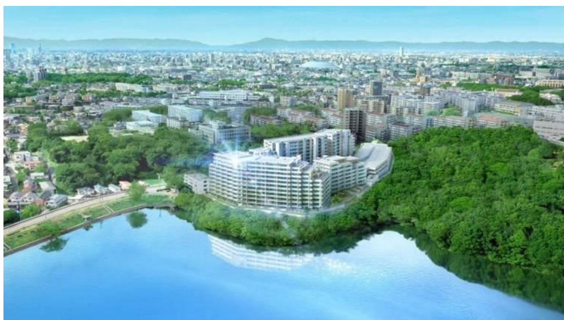
イメージ図：全体鳥瞰図

『ラグナヒルズ』は、南側に「猫ヶ洞池」、東側には「東山の森」が広がる東山丘陵に抱かれた都心からわずか 6 キロ圏に位置する全 300 邸の分譲マンションです。