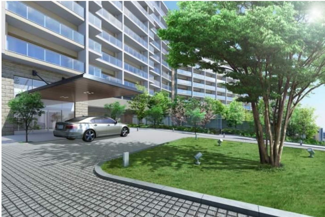
イメージCG: 車寄せのあるメインエントランス