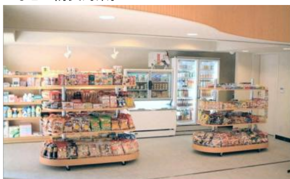
イメージ写真:ラグナマート