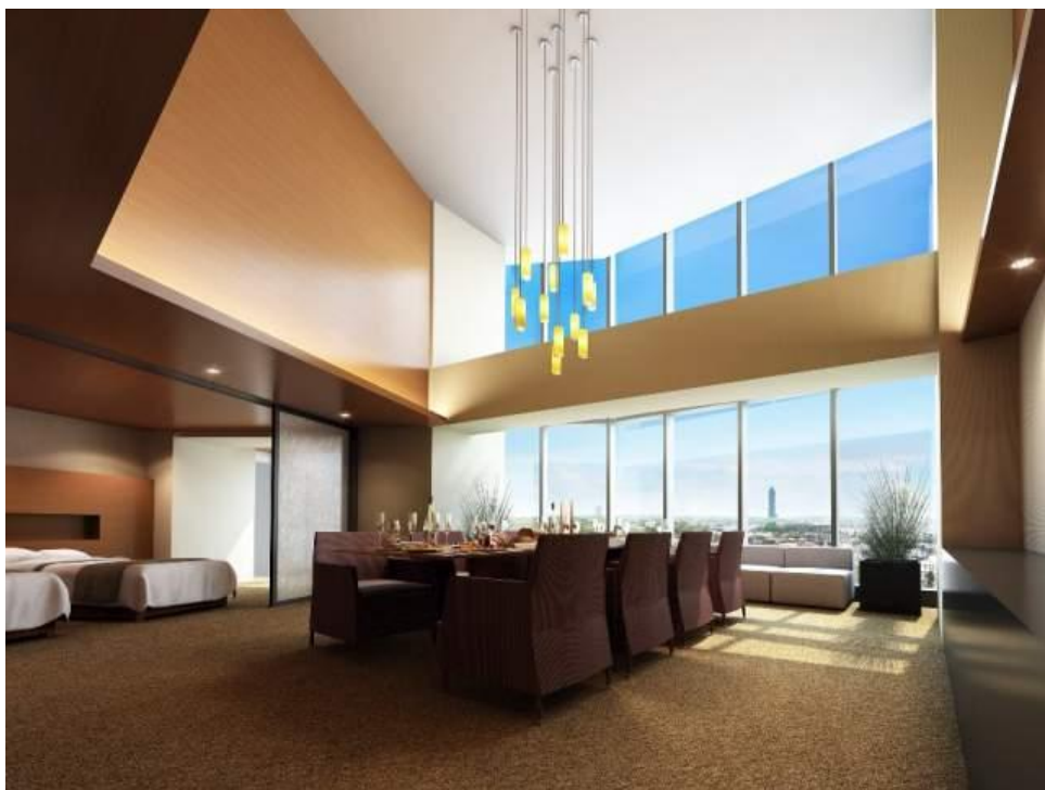
イメージCG: ゲストルーム