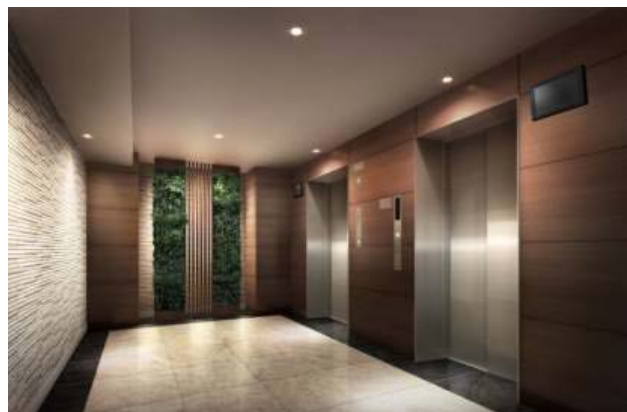
〈エレベーターホール 完成予想図〉