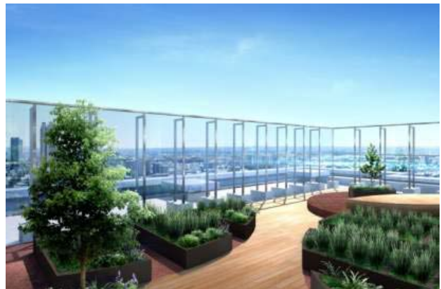
〈スカイテラス 完成予想図〉