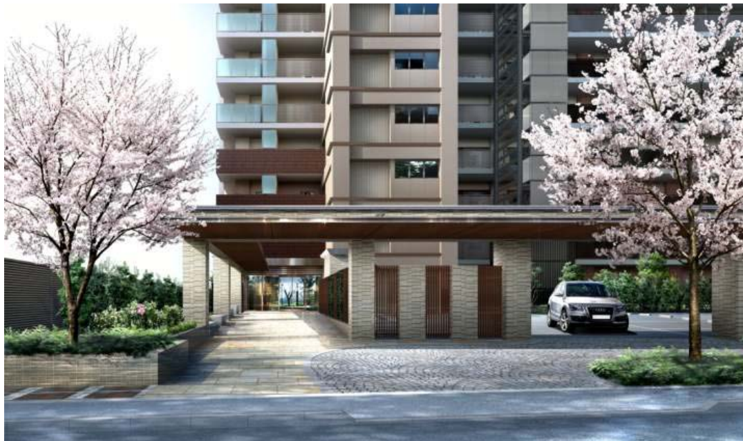
〈プライド大宮 エントランスゲート完成予想図〉