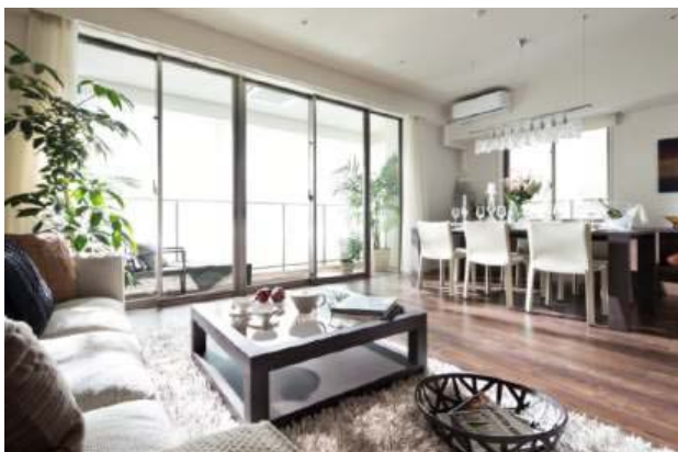
〈モデルルーム 写真〉