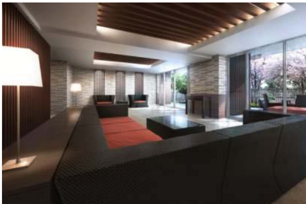
〈ラウンジ 完成予想図〉

【プライド王子本町ディアージュ】 http://www.proud-web.jp/mansion/ouji2/