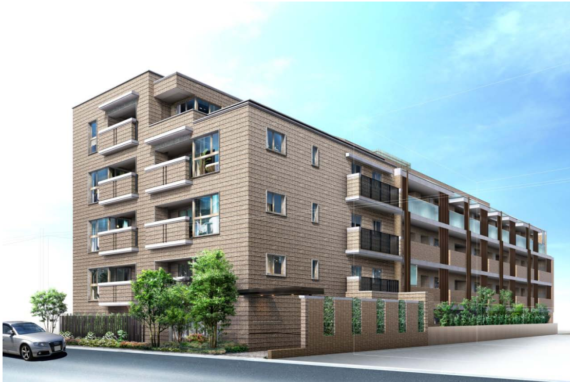
【プライド市ヶ谷南町ディアージュ 外観完成予想図】

◆プライド市ヶ谷南町ディアージュ http://www.proud-web.jp/mansion/ichigaya2/