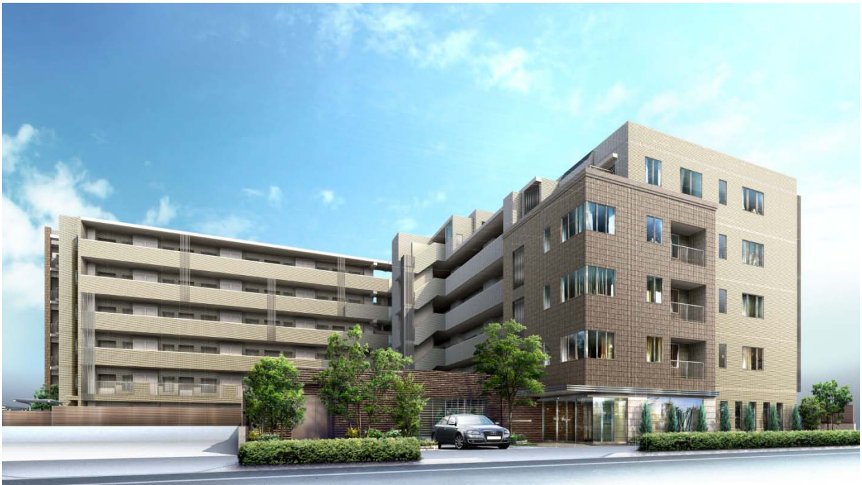
【プラウド南浦和 外観完成予想図】

◆ プラウド南浦和 http://www.proud-web.jp/mansion/minamiurawa/