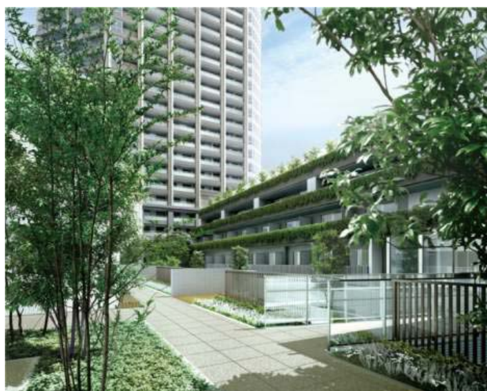
Pent terrace 完成予想図