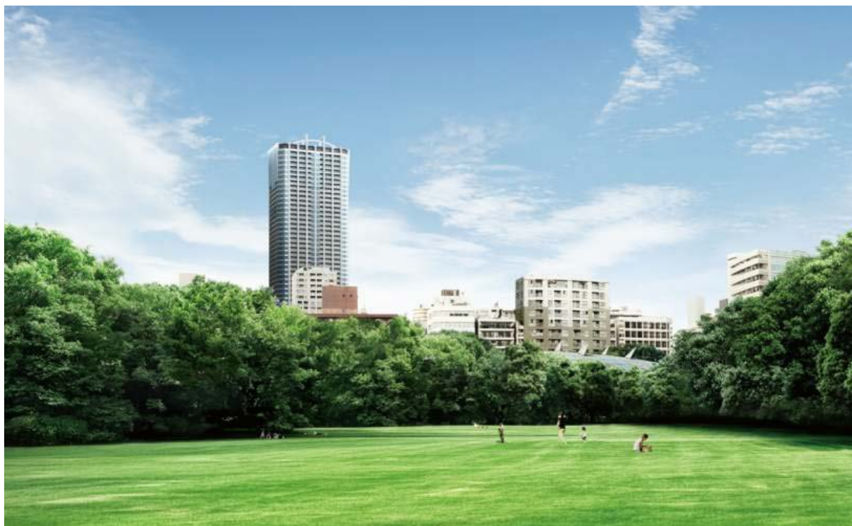
Tomihisa Cross Comfort Tower 外観完成予想図