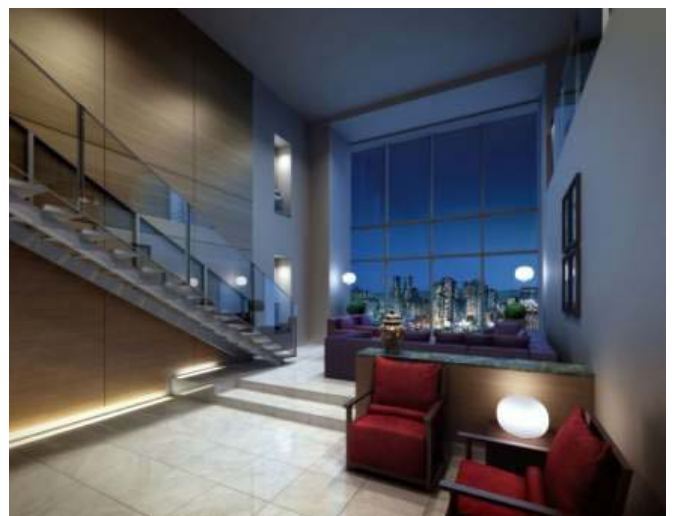
Comfort Tower スカイラウンジ完成予想図