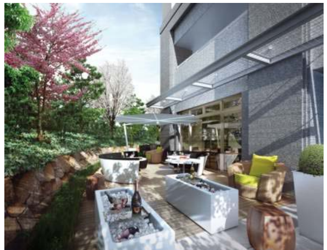
Comfort Tower グリーンテラス完成予想図