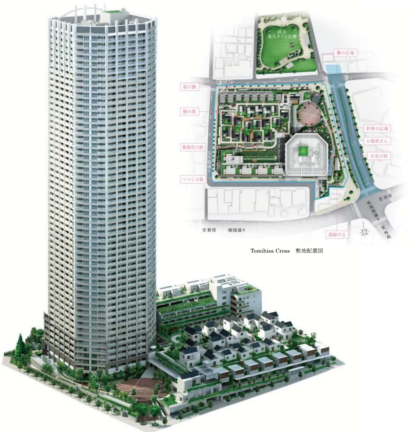
Tomihisa Cross 敷地配置図

(※1993年～2012年11月の期間にJR山手線内において分譲された新築民間マンションで55階建1093戸は最大となります。MRC調べ)