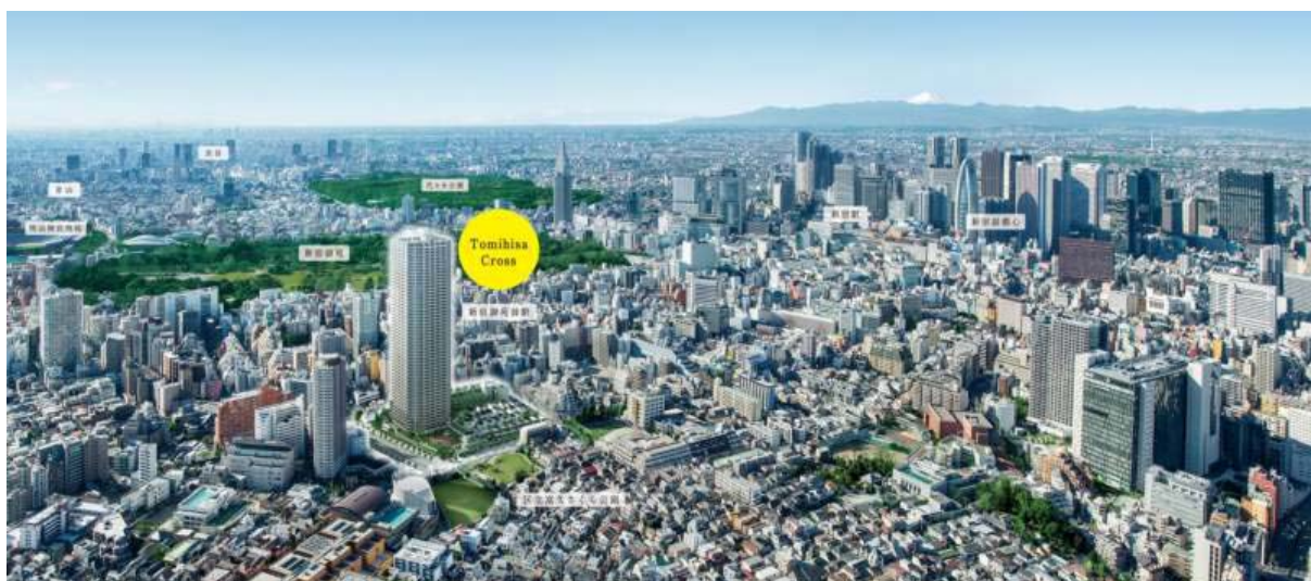
Tomihisa Cross 外観完成予想図