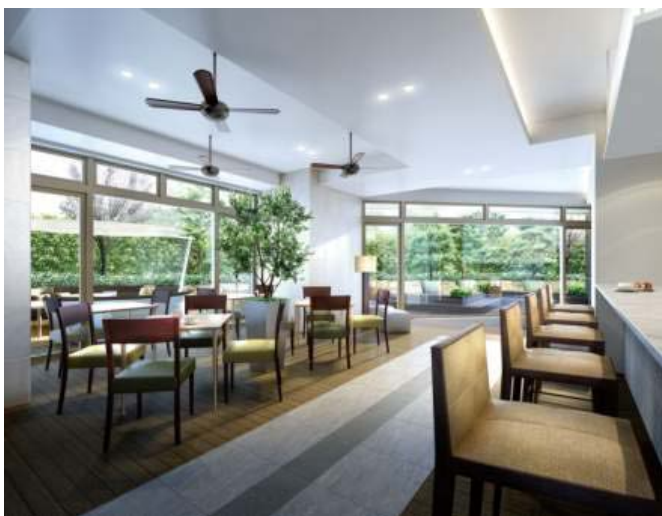
Comfort Tower グリーンカフェ完成予想図