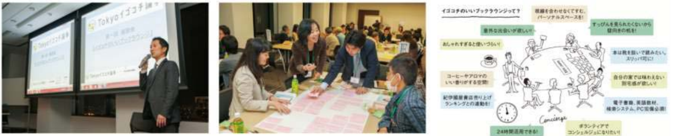
第1回「イゴゴチ座談会」の様子 たくさんの方にご参加いただき、白熱する議論が展開されました。

例えば、車寄せからエントランスラウンジまでのちょっとした“イゴゴチ”や暮らしのあらゆるシーンを想定し、用途に合わせて使い分けができる10のラウンジなど寄せられた様々なアイデアを具現化し、“世界一のイゴゴチ”を実現しようとしています。