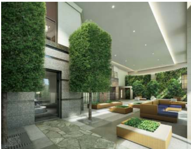
Comfort Tower エントランスホール完成予想図