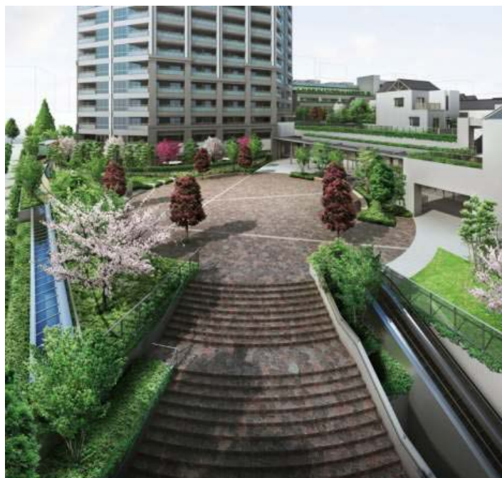
彩華の広場 完成予想図