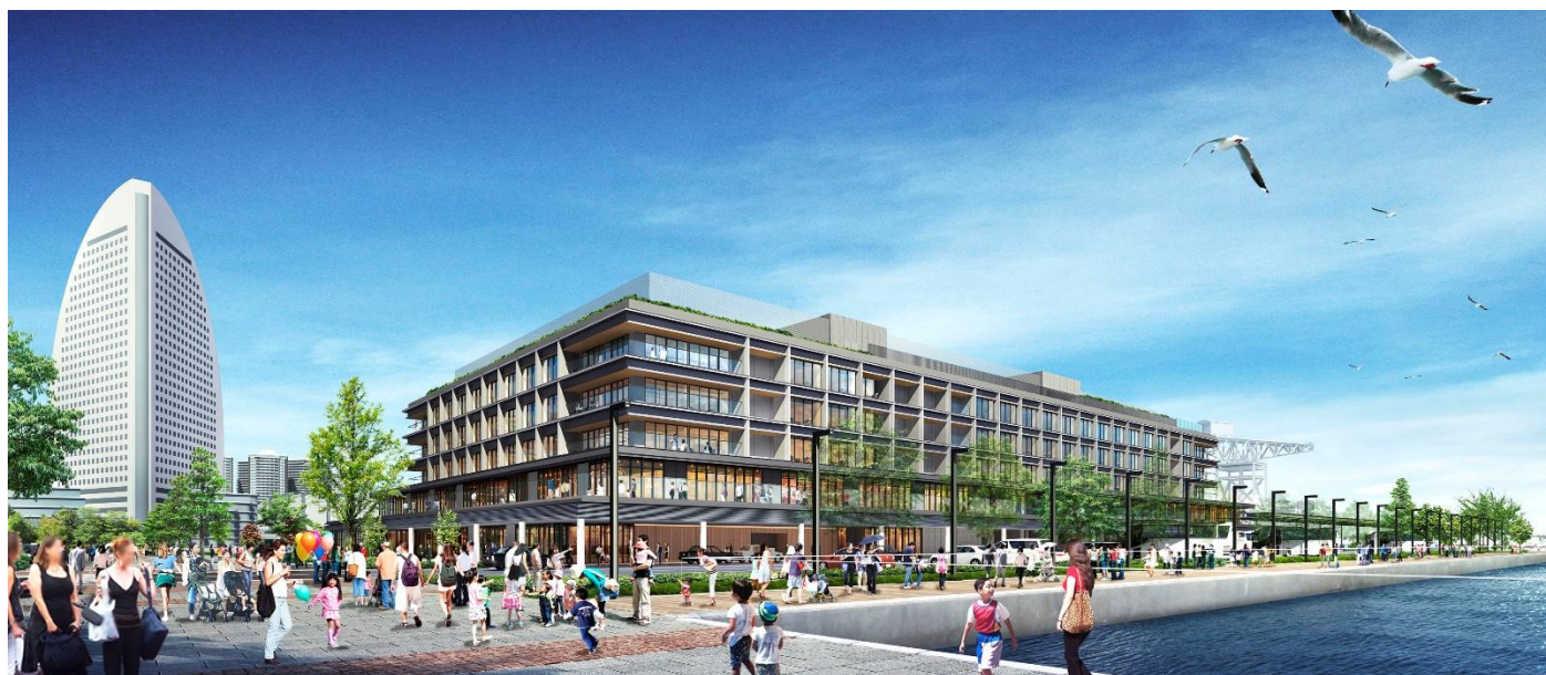
「客船ターミナル」「商業」「ホテル」一体型複合施設『YOKOHAMA HAMMERHEAD』完成イメージ