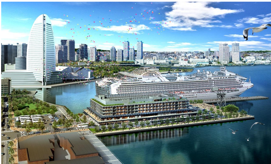
ダイヤモンド・プリンセス入港時のイメージパース

横浜港の中でも新港ふ頭客船ターミナルは、11 万 6 千総トン級の客船にも対応できるよう、公共岸壁の改良により総延長 340m、水深 9.5mに変更。そして新港ターミナル第 1 号入港としてカーニバルコーポレーション社のダイヤモンド・プリンセスを 2019(令和元)年 11 月 4 日に予定しています。