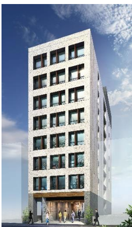
(仮称) H 1 O 日本橋小舟町外観イメージ

【H 1 O (Human First Office) シリーズ公式 WEB サイト URL https://h1o-web.com 】