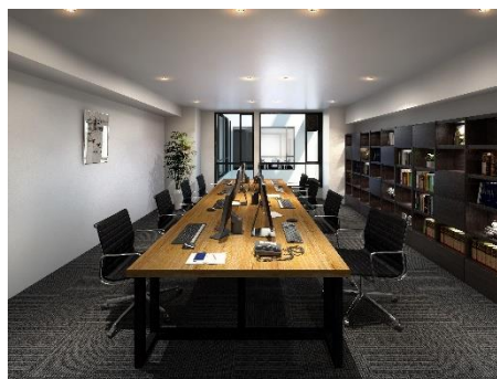
H 1 O 日本橋小舟町貸室イメージ CG