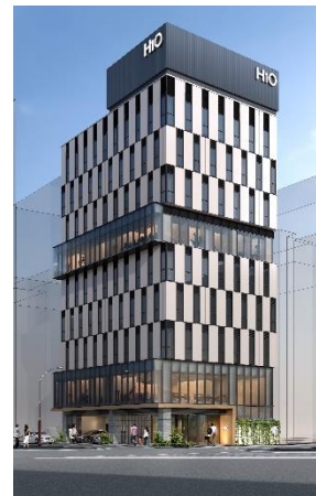
(仮称) H 1 O 神田イメージ