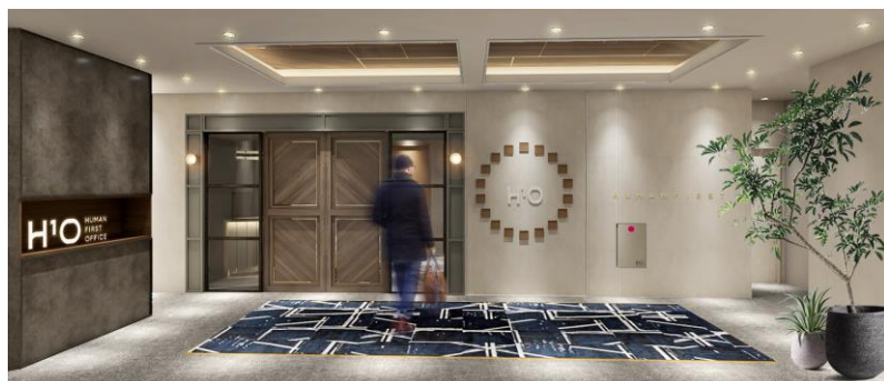
H 1 O 日本橋室町エントランスイメージ

H 1 O は、これまで当社が中規模オフィス P M O 事業で培ってきた「ヒューマンファースト」の価値観をスモールビジネスやフリーランスの方に特化して展開する新たなサービス付き賃貸オフィス事業です。オフィスで働く一人一人に寄り添い、“個”のポテンシャルを最大化し社会に変革をもたらす得るスモールビジネスを支援する新時代のオフィスとして、今後展開してまいります。