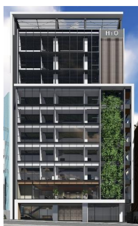
(仮称) H 1 O 渋谷神南イメージ