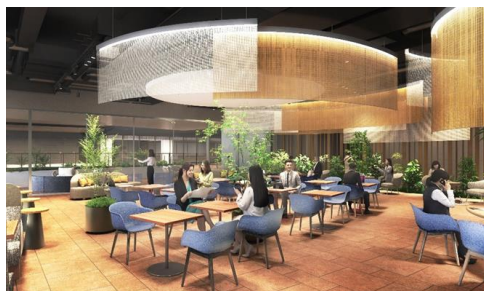
入居企業専用ラウンジ 完成予想パース