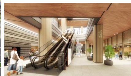
地下広場完成予想パース