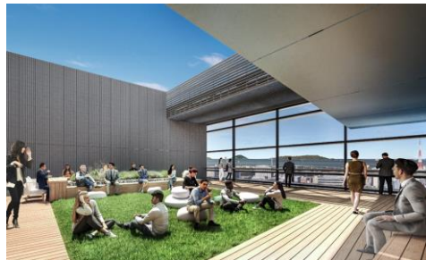
屋上ラウンジ 完成予想パース