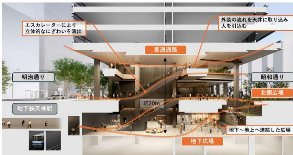
交通利便性が高く各種イベント等も可能な低層部（断面イメージ）