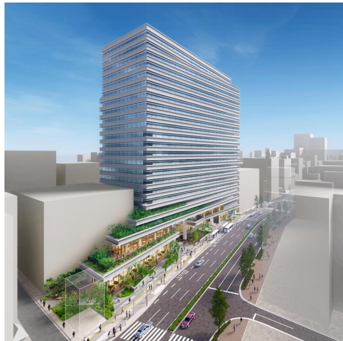
外観完成予想パース

野村不動産株式会社（本社：東京都港区／代表取締役社長：松尾大作）と株式会社竹中工務店（本社：大阪府大阪市／取締役社長：佐々木正人）が推進している「（仮称）福岡天神センタービル建替計画」（福岡県福岡市中央区天神 2 丁目 198 番 1 外／以下、本計画）は、2025 年 12 月 15 日に起工式を執り行い、12 月 16 日に着工しました。