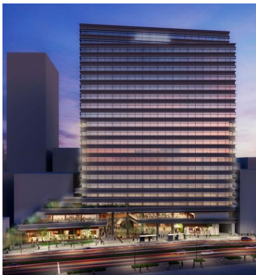
外観完成予想パース