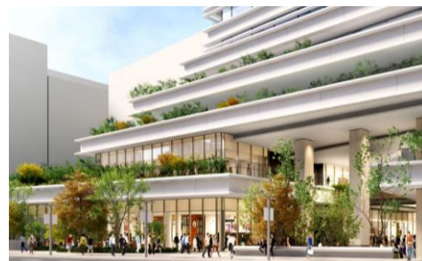
昭和通り側エントランス完成予想パース