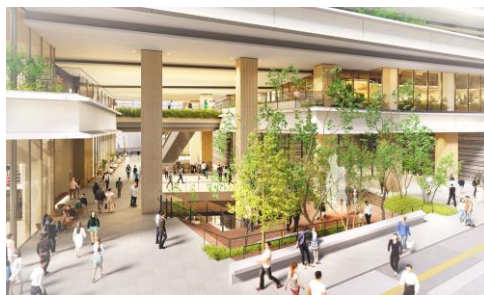
昭和通りからの貫通路完成予想パース