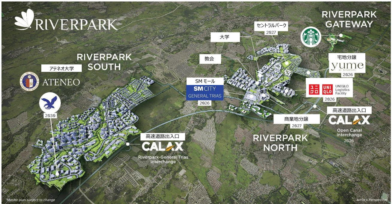
(画像内の数字はすべて開業(予定)年を示しています)