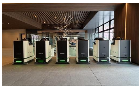
【プラウドタワー相模大野クロスの外観（左）と掃除ロボット STRIVER II（右）】