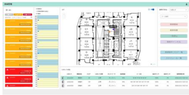
【ロボットマネジメントシステム画面】