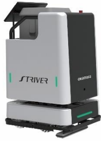
【掃除ロボット STRIVER II】