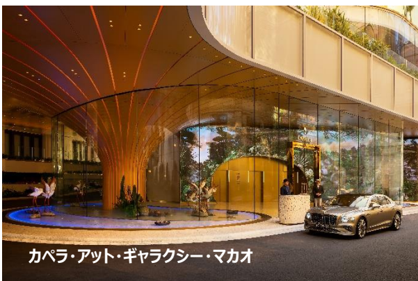
カペラ・アート・ギャラクシー・マカオ