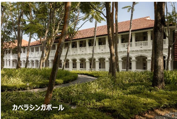
カペラシンガポール

こうした洗練されたサービスと高いホスピタリティは国際的にも高く評価されており、旅行専門誌「Travel + Leisure」で3年連続「世界第一位のホテルブランド」に選出されました。さらに、カペラを象徴するシグネチャースパ「Auriga Spa（アウリガ スパ）」では、月のサイクルに着想を得たプログラムを通じて、地域の特性に応じたウェルネス体験を展開しています。