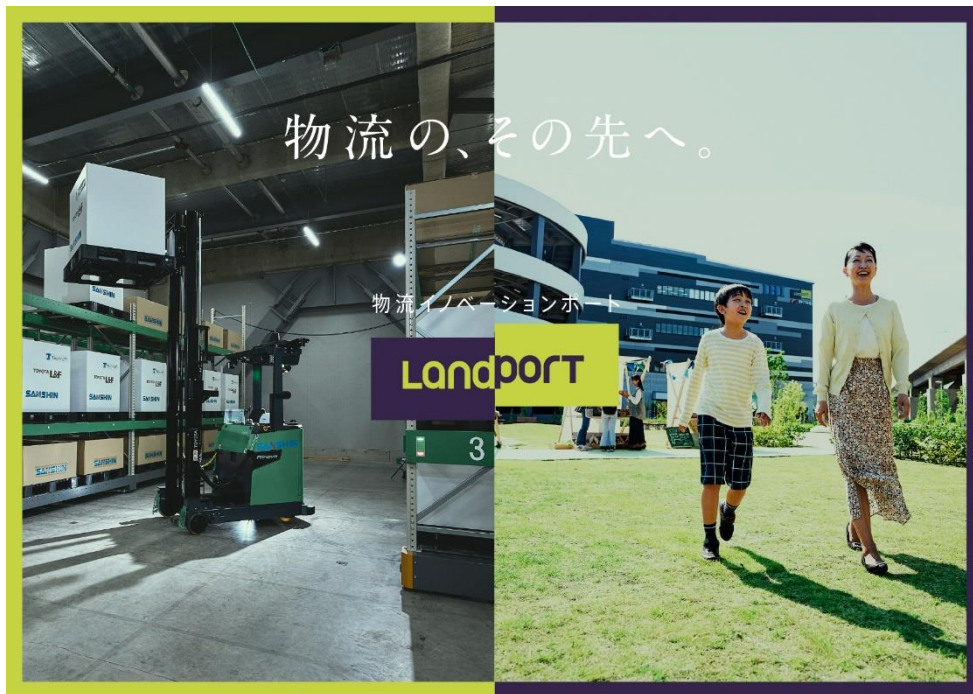
【新しく作成した「Landport」ブランドムービーのサムネイル】

また、本イベントでは、当社が今後目指していきたいと考える物流施設のコンセプトを皆さまにもご覧いただけるよう、この度新しく作成した当社の高機能型物流施設「Landport」のブランドムービーも公開する予定です。