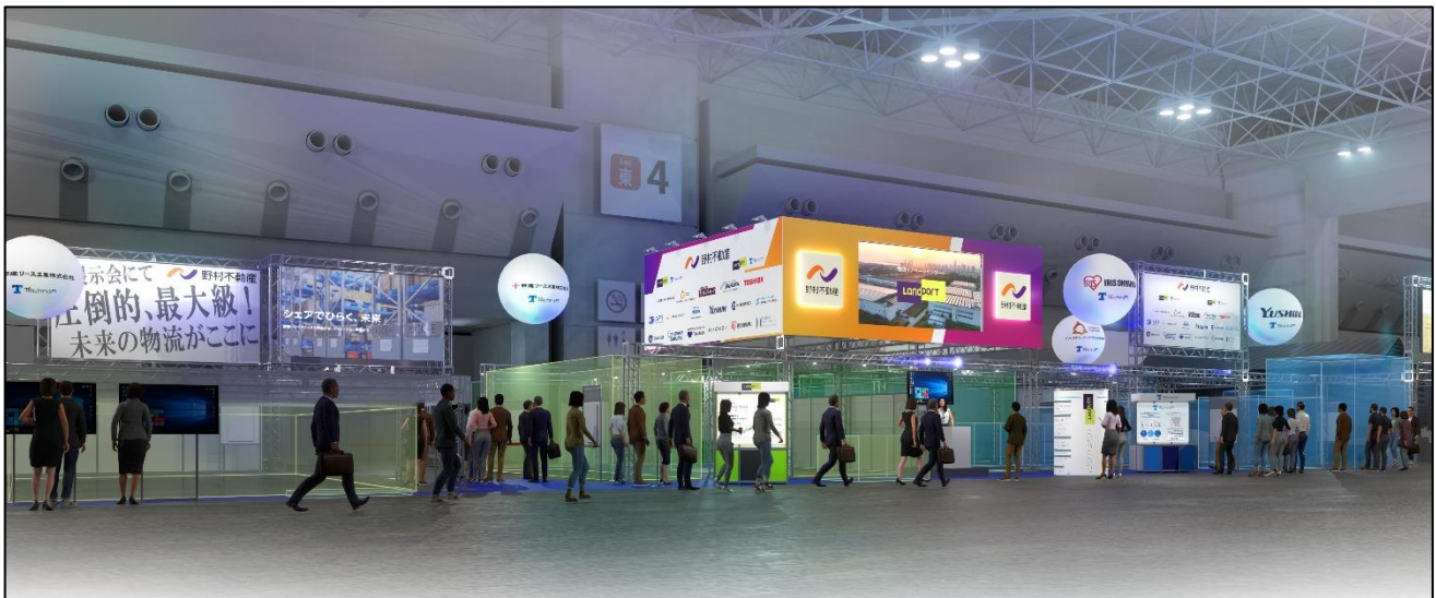
【本イベントにおける当社ブースのイメージパース】

今般、Techrum のパートナー企業 17 社様と共に、9 月 10 日～12 日に開催される「国際物流総合展 2025 第 4 回 INNOVATION EXPO（以下「本イベント」）」に、イベント史上最大規模での出展を行うことになりましたのでお知らせいたします。今後も当社は Techrum パートナー企業との連携を通じて、荷主・物流企業の課題やニーズに応える様々なソリューション開発や効果検証に取り組み、物流業界の人材不足の早期解消に貢献してまいります。